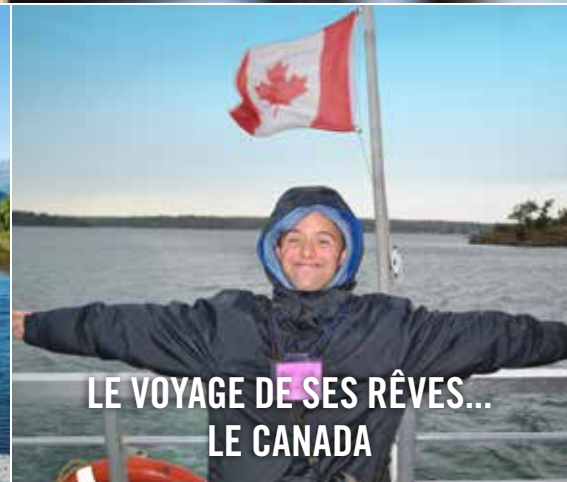
LE VOYAGE DE SES RÊVES... LE CANADA