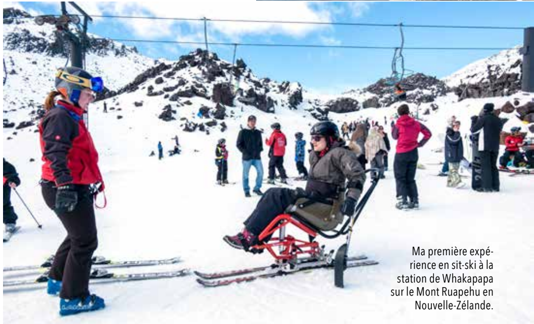
Ma première expérience en sit-ski à la station de Whakapapa sur le Mont Ruapehu en Nouvelle-Zélande.