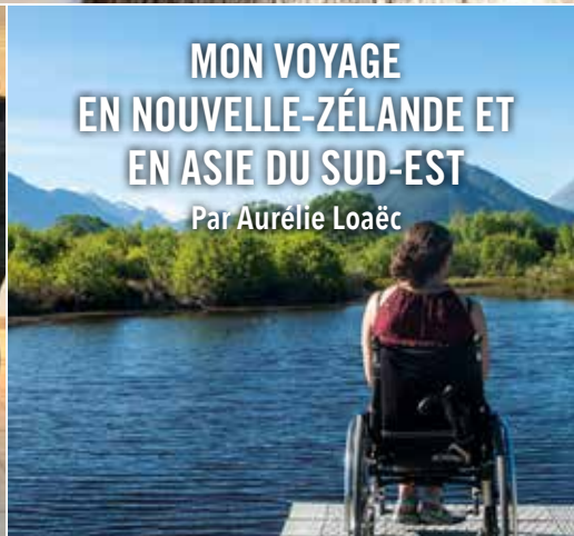
MON VOYAGE EN NOUVELLE-ZÉLANDE ET EN ASIE DU SUD-EST