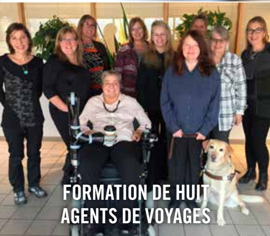
FORMATION DE HUIT AGENTS DE VOYAGES