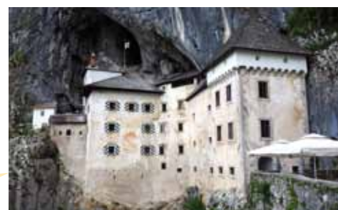
Château de Predjama

nous. Cela représente une économie considérable puisque l'entrée était de 23 euros par personne!