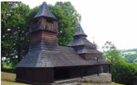
Église en bois

Les villages toujours habités de Levoca et Bardejov sont tout mignons. Leurs places centrales apportent beaucoup à l'ensemble. Elles sont entourées de superbes maisons de l'époque de la Renaissance.