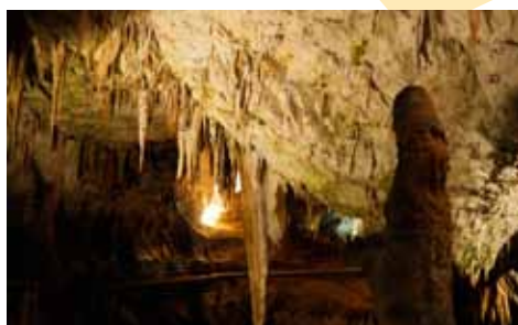
Grotte de Postojna

Les musées et sites touristiques sont dans l'ensemble accessibles. Des places de stationnement sont réservées aux personnes avec handicap près de l'entrée. De plus, des rabais considérables sont souvent accordés à ces personnes et à leur accompagnateur. Parfois, c'est même gratuit!