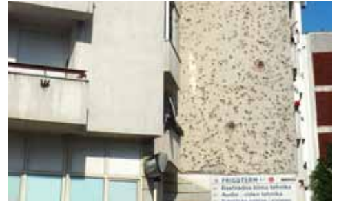
Maison criblée de balles en Bosnie-Herzégovine

En terminant, une note sur la Bosnie-Herzégovine. Je n'ai pas tellement apprécié. Ce pays me pèse sur le cœur. Il est triste. Les gens semblent porter tout le poids du monde sur leurs épaules. Ils sont calmes et sérieux. Ça peut se comprendre : dans le sud du pays particulièrement, il y a plein de maisons et d'immeubles qui ont été la cible des tireurs lors de la guerre. Parfois, les trous laissés par les balles ont été comblés; on a refait le crépi. Mais souvent, rien n'a été fait pour faire disparaître les traces laissées par les balles.