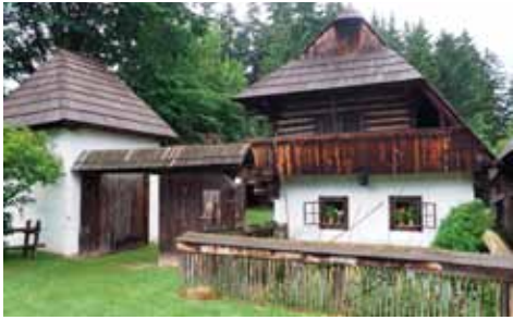
Musée en plein air en Slovaquie