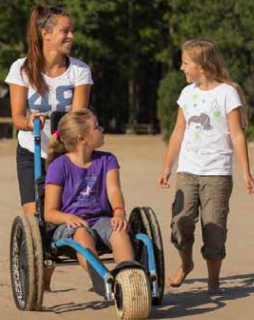
Parc national d'Oka, Sépaq © Mathieu Dupuis

Quand la douche n'est plus suffisamment rafraîchissante, une baignade dans un environnement extérieur est attirante! Peu importe son handicap, il est possible de profiter de quelques installations, que ce soit des piscines publiques ou des plages. Certaines comportent seulement un vestiaire avec douches et toilettes accessibles, alors que d'autres proposent même des rampes d'accès à l'eau, un prêt de fauteuil roulant aquatique ou un lève-personne.