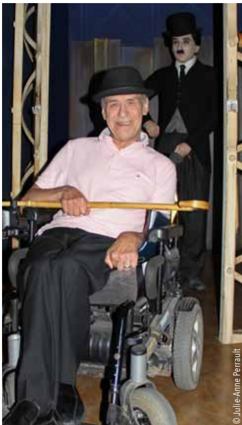
Visite du Musée Grévin qui met en scène des célébrités de cire plus vraies que nature!