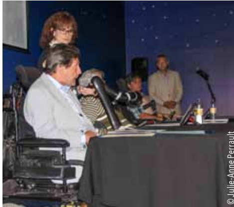
Présentation des réalisations de Kéroul au niveau de la représentation, de la recherche et du développement, de la formation, de La Route Accessible , des communications et de l'administration.