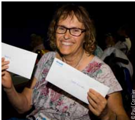
Tirage de prix de présence : deux livres d'art, une paire de billets pour les Alouettes et un certificat-cadeau de 250 $ dans les chalets U!