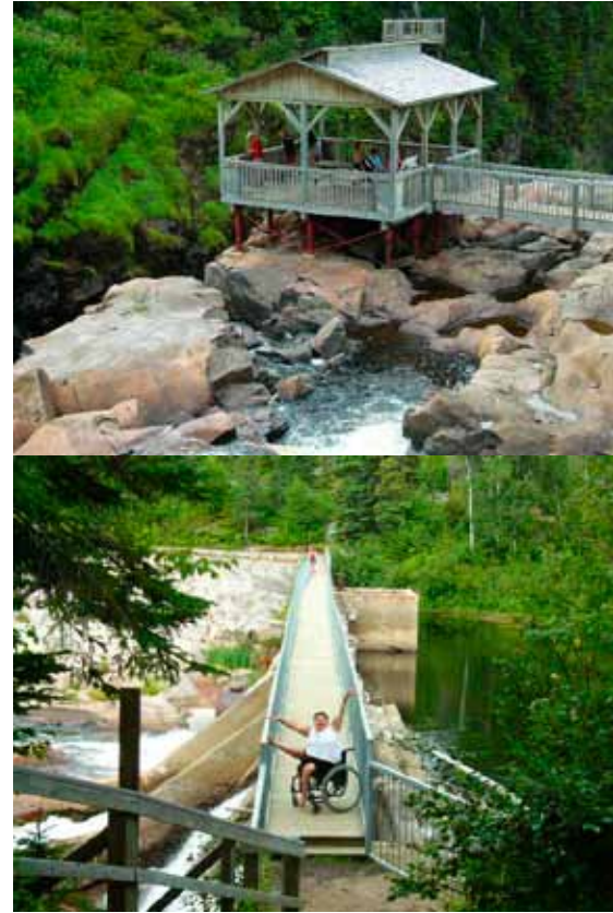
Passerelle et gazebo de la Rivière-à-Mars

Nous avons beaucoup d'affection pour cette région car les gens y sont accueillants et la nature est généreuse et remplie de belles surprises. Il est préférable d'avoir son propre véhicule pour se déplacer dans les zones touristiques assez bien adaptées. De gros efforts sont faits pour nous rendre la vie agréable. Cet été pensez au Saguenay-Lac-Saint-Jean et partez à l'aventure!