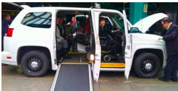
Le taxi MV-1

Le MV-1 (acronyme pour « Mobility Vehicle 1 »), le seul véhicule universellement accessible conçu et assemblé en usine, est dédié au transport de passagers à mobilité réduite dans les secteurs public ou privé. Disponible depuis janvier 2012 aux États-Unis et depuis mai 2012 dans le reste du Canada, le MV-1 a fait l'objet d'un lancement officiel au Québec le 25 février dernier. Un projet pilote est en cours à Montréal, Laval et Longueuil afin de recueillir les commentaires des chauffeurs et des utilisateurs.