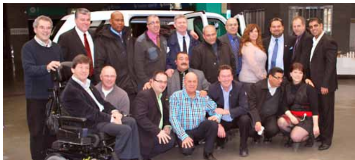
Kéroul était présent lors du lancement du MV-1.