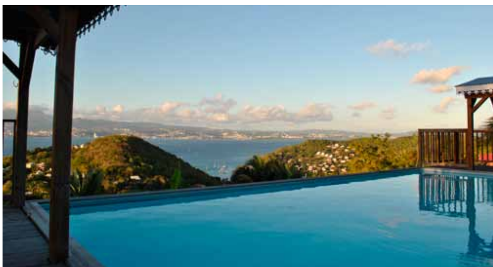
La piscine et une vue de la Baie-de-Fort de France.