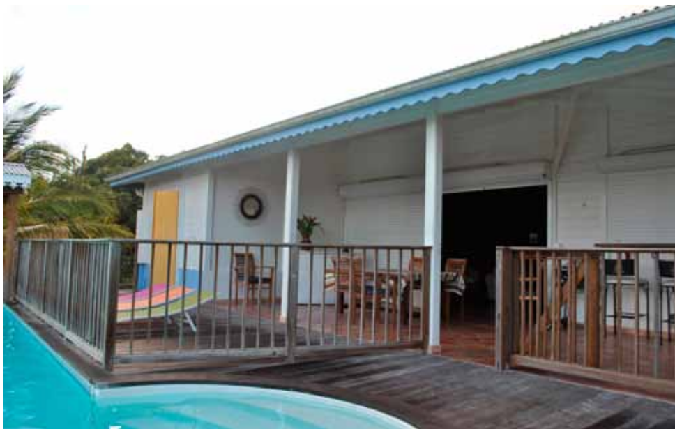
Villa Desloges.

Vous devinez sans doute que nous avons fait un merveilleux voyage. On pense même y retourner. Que ce soit pour les paysages, la nourriture, la superbe villa Desloges ou la gentillesse des gens : la Martinique est un endroit absolument enchanteur !