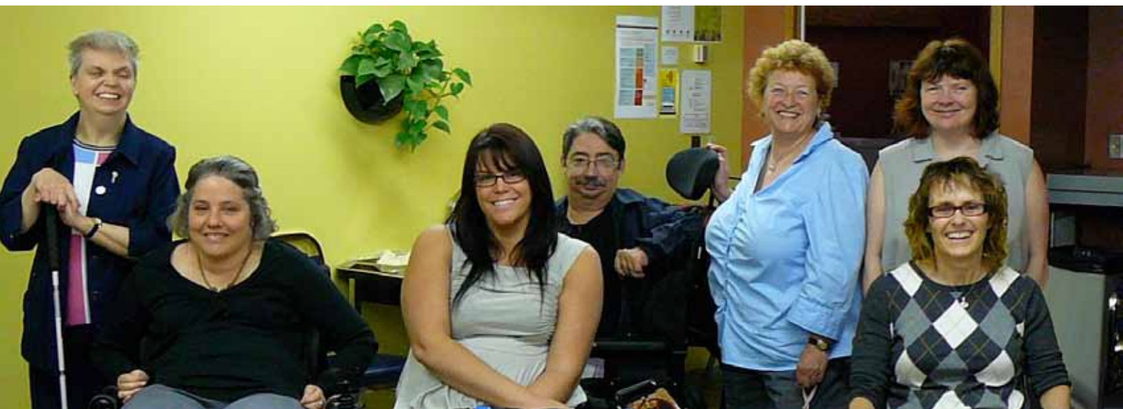
L'équipe de formateurs de Service Complice

Bénéficiez de conseils d'experts grâce à la formation Service Complice! Formations d'une demi-journée ou d'une journée complète