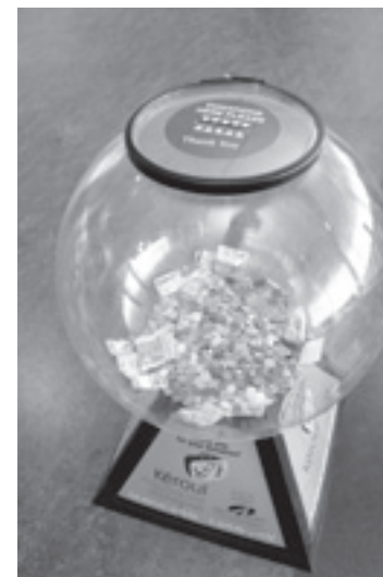
Cloche de verre

Saviez-vous qu'à l'Aéroport Montréal-Trudeau, il y a plusieurs cloches de verre dans lesquels les voyageurs peuvent y déposer de la monnaie de tous les pays du monde. D'un pays à l'autre, il est impossible d'échanger de la monnaie étrangère, nous proposons aux voyageurs de déposer cette monnaie dans les cloches Kéroul. Deux fois par année, ADM nous fait parvenir les montants d'argents déposés dans les cloches et nous l'utilisons pour développer La Route Accessible .