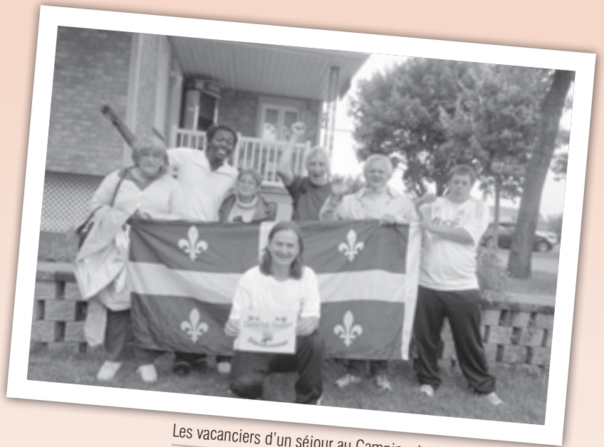
Les vacanciers d'un séjour au Camping Juneau, près de Québec

Départ de Montréal le 23 décembre 2011 à bord d'un véhicule adapté pour 2 nuits/3 jours vers la ville de Gatineau-Ottawa.