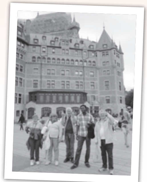
Une escapade dans la ville de Québec