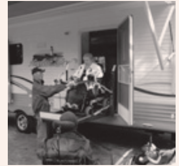
Visite de la roulotte adaptée

Réaliser le projet d'évaluation des quais et bateaux de croisières excursions du Québec;