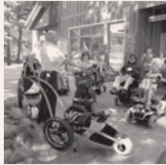
Démonstration du fauteuil hippocampe

Poursuivre le projet d'évaluation et promouvoir les pistes cyclables accessibles;