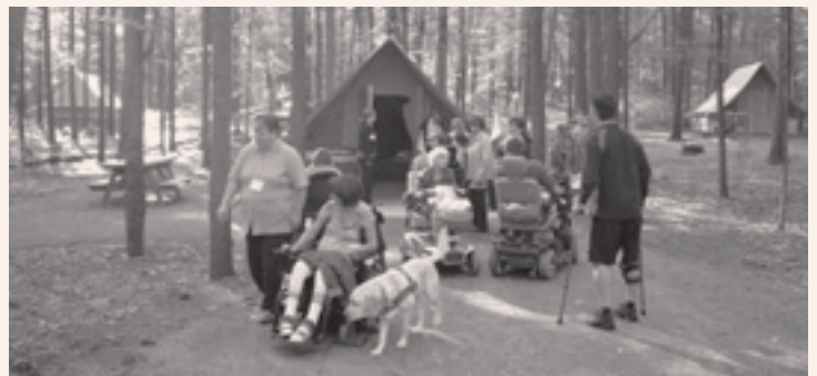
Visite de la tente Huttopia

Renégocier le protocole triennal avec le ministère du Tourisme du Québec.