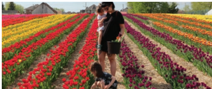
Tulipes autocueillette