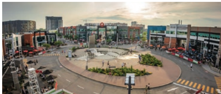
Les Terrasses éclatées du Centropolis

Parmi les commerces et attraits du lieu, le Clip 'n climb se distingue par son offre divertissante et inclusive d'escalade pour petits et grands. Passionnés de sensations fortes? Le centre de chute libre iFly promet une expérience unique. Des baudriers (harnais) spéciaux sont disponibles afin de permettre aux participants en situation de handicap de maintenir leurs jambes dans la bonne position et de pouvoir s'élancer dans les airs en toute sécurité.