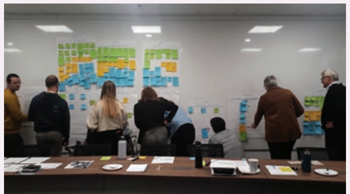
L'équipe de Kéroul en pleine réflexion stratégique!

Au final, le plan stratégique de Kéroul 2023-2026 a été entériné par le conseil d'administration à sa séance du 23 janvier 2023.