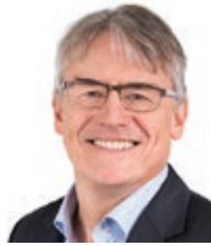
Photo de la page couverture