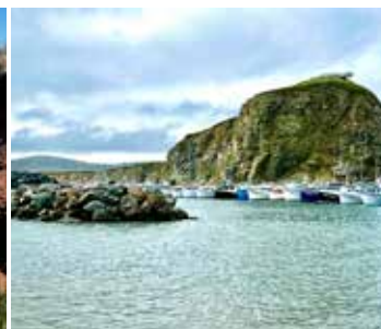
Cap-Dauphin, Cantine à homard