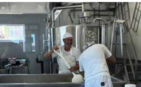
Économusée La Fromagerie du Pied-De-Vent