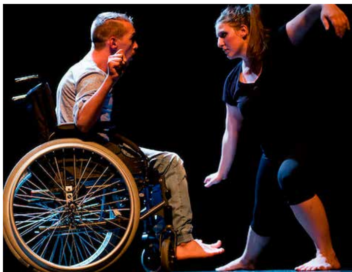
© Vicky Métayer - Réseau d'enseignement de la Danse, Enseignement de la danse inclusive adaptée

Beaucoup d'organismes et d'institutions culturelles usent de créativité et font de remarquables efforts pour élaborer des actions culturelles professionnelles et amateurs sur mesures pour une offre élargie. Bien que la volonté soit présente, des enjeux importants sont présents et peuvent causer des choix difficiles ou l'abandon d'initiatives au détriment des besoins des clientèles atypiques. Bien que différents programmes d'aides financières et d'accompagnements spécialisés soient disponibles, beaucoup de gestionnaires ignorent leurs existences et sont confrontés seuls au défi de rendre leurs installations et programmations