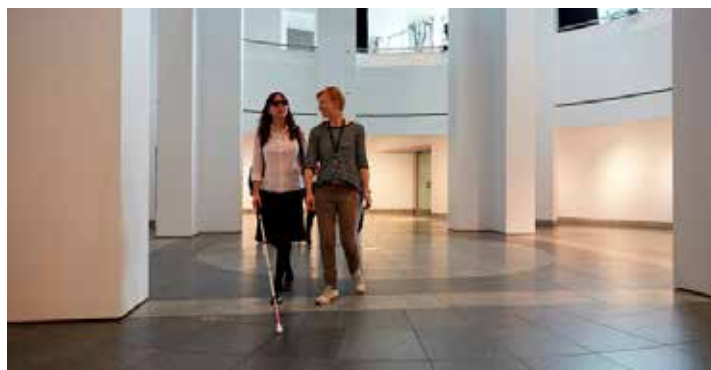
© Musée d'art contemporain de Montréal - Inclusion en action

Depuis quelques semaines, Kéroul prépare un guide afin d'outiller et inspirer les gestionnaires culturels. Sous la forme de fiches simples et conviviales, cet ouvrage permettra de regrouper et de vulgariser les connaissances pratiques au Québec et d'ailleurs, et sera une belle vitrine pour les initiatives ayant eu des impacts et des retombées importantes pour l'accès aux arts et à la culture pour tous. Si vous voulez partager vos initiatives, n'hésitez pas à contacter Kéroul, et qui sait, peut-être serez-vous l'inspiration d'un futur programme d'actions culturelles inclusif! Ce guide sera disponible dès le début de 2022 et sera un excellent outil afin de construire des ponts entre la culture et toutes les clientèles passionnées d'arts!